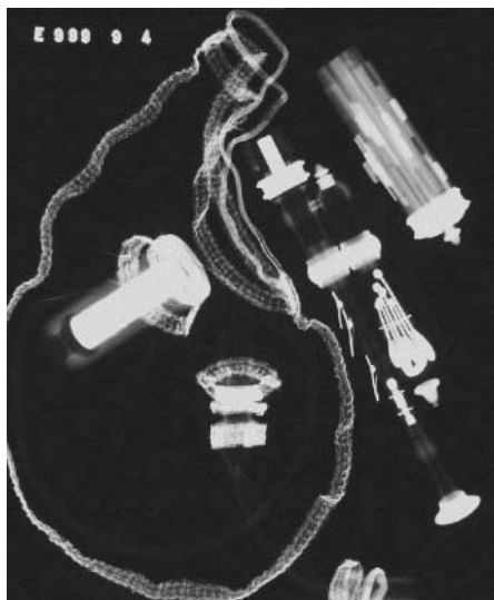
Radiographie : Musée de la musique

Des fiches pratiques, éditées par le service d'informations musicales, enrichissent cette base et présentent un accès toujours actualisé aux informations disponibles.